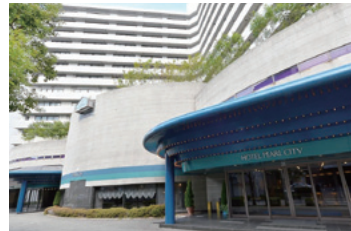
ホテルのエントランス