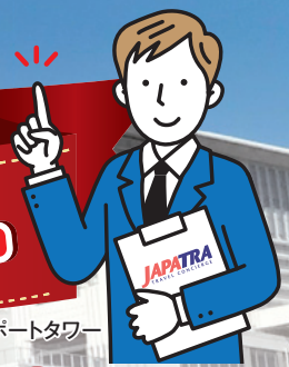
神戸ポートタワー