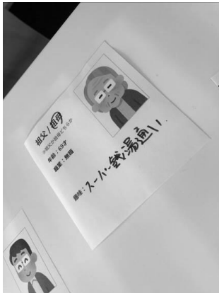
図 1 ペルソナ