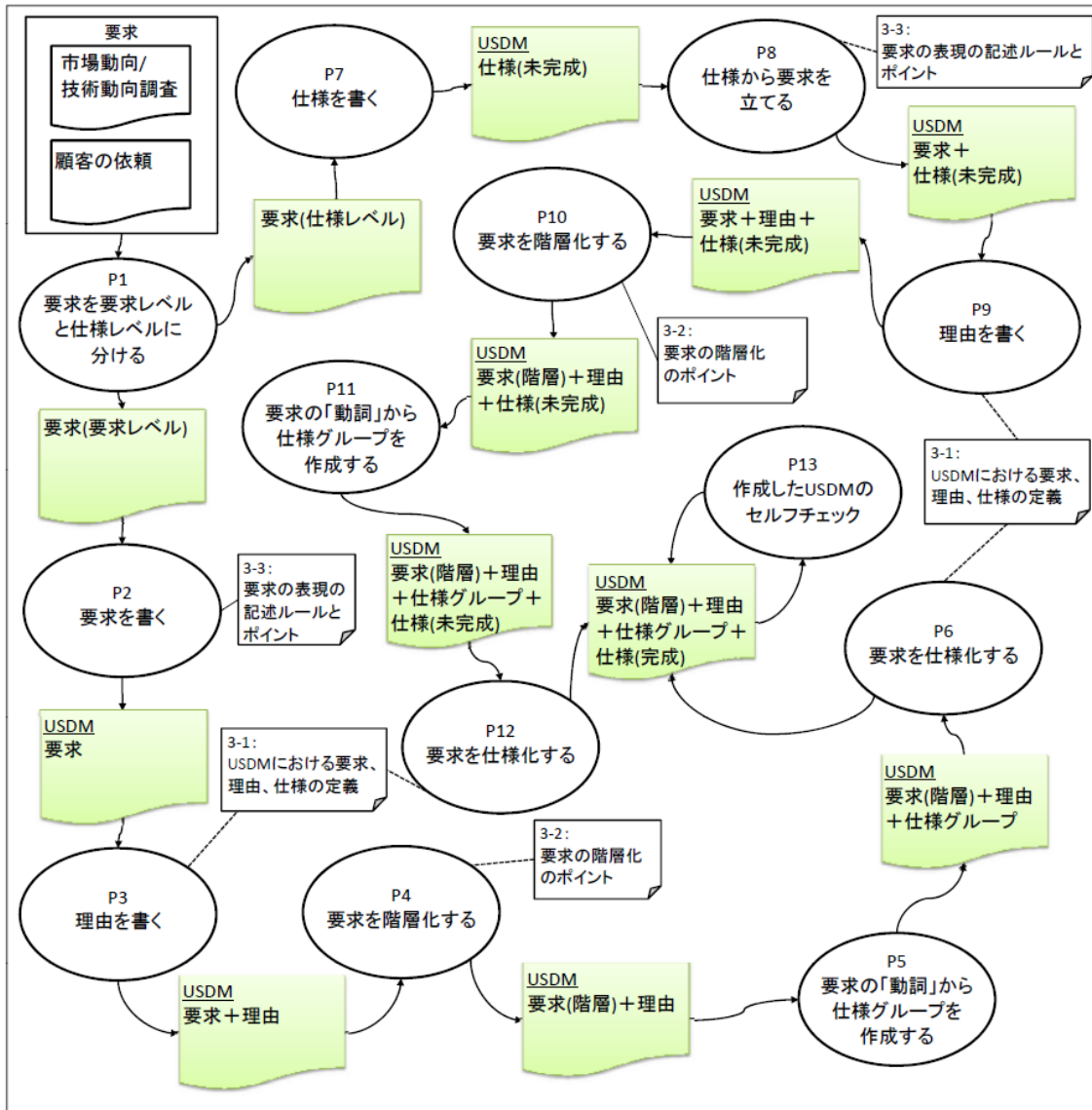
図 1 USDM 記述の流れ

本章では、USDM 形式で仕様を記載する流れを説明します。USDM 形式で仕様を記述する際は、図 1 の流れで作業を進めることができます。「P1:要求を要求レベルと仕様レベルに分ける」で 2つの方向に手順が分岐していますが、これは要求に「仕様レベル」であるものが混ざっていることがあるためです。「P1」で要求が「要求レベル」か「仕様レベル」であるかを判断し、「要求レベル」である場合は、「P2:要求を書く」以降の手順に進み、「仕様レベル」である場合は、「P7:仕様を書く」以降の手順に進みます。