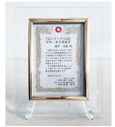
『QCサークル』誌活用・普及貢献賞 楯

QCサークル感動賞は、1996年(平成8年)4月に開催した一閃の全国大会から新設した賞です。全国大会では全発表の中から、「自分たちもあのような活動がしたい」、「自分はあるような活動に共感できる」、「仲間に感動を与えるあのような活動をしてみたい」など、共感と感動を覚えた発表サークルを参加者全員と講師者に選出いただき、「QCサークル感動賞」として表彰します。