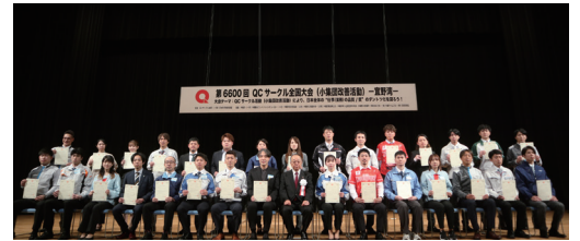
第6600回QCサークル全国大会ー宜野湾ー QCサークル感動賞記念撮影

第6600回QCサークル全国大会(小集団改善活動)ー宜野湾ー QCサークル感動賞 受賞サークル一覧(30件)(発表順)