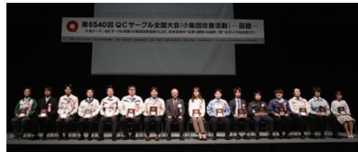
QCサークル石川 馨賞授賞式