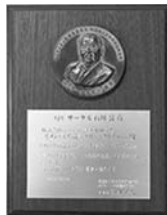
石川 馨賞 楯

「QCサークル石川馨賞」は、QCサークル活動の生みの親であり、育ての親でもある、故石川馨博士の偉大な業績をたたえ1965年に「FQC賞」として創設され、1990年に「QCサークル石川馨賞」に改称しました。2013年1月に、本賞の目的である「模範的または特色ある活動を行っているQCサークルを表彰することにより、QCサークル活動の活性化と水準向上に寄与すること」を一層達成するために、新たに「QCサークル石川馨奨励賞」を創設しました。これにより、みなさんに受賞のチャンスが広がります！