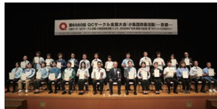
第6560回QCサークル全国大会ー京都ー QCサークル感動賞記念撮影

第6560回QCサークル全国大会(小集団改善活動)ー京都ー QCサークル感動賞 受賞サークル一覧(27件)(発表順)