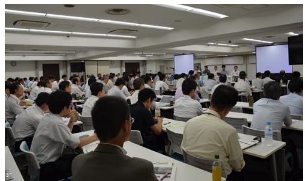
満員の特別企画セッション会場

「信頼性設計の新たなパラダイムシフト～データサイエンスによる信頼性設計プロセスの新たな変革」をテーマに、パネリスト 4 名による発表とパネルディスカッションが行われました。2 日目の午前中をすべて本セッションだけにあてる初めての試みでしたが、当日の会場は、立錫の余地がないほどの参加者で、関心の高さが伺われました。