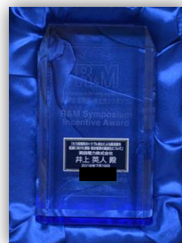
右:受賞者に贈られるクリスタルの盾

次は、表彰式です。昨年度の一般発表報文の中から、参加者の得票数をもとに選考された「推奨報文賞」3件、審査委員の選考による「奨励報文賞」「特別賞」各1件の授与が行われました。