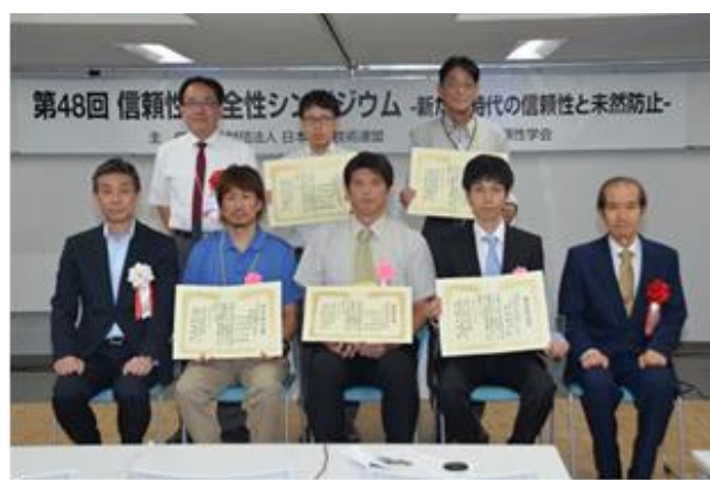
受賞者の皆さん:シンポジウム組織委員会役員と日科技連役員と