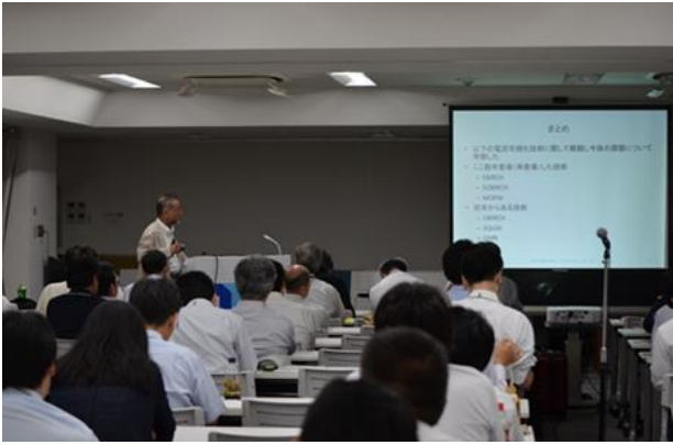
A 会場の発表の様子