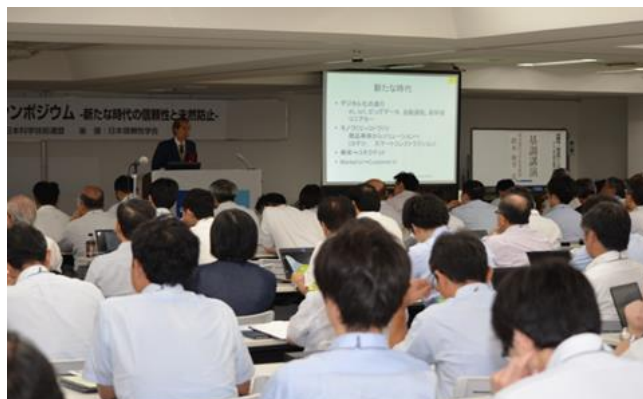
基調講演に耳を傾ける参加者のみなさん