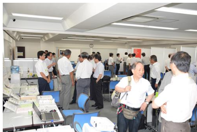
展示コーナーでは、そこそこで交流の輪ができていました

このほか、講演や発表を聞くだけでなく、実際に実機を見たり、触れたりできる展示コーナーもあります。本コーナーは、参加者の憩いのスペースもかねており、昼食休憩時などは、あちらこちらで情報交流の輪ができ、にぎわっていました。