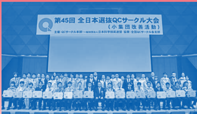
発表サークルの記念撮影 (2015年度)